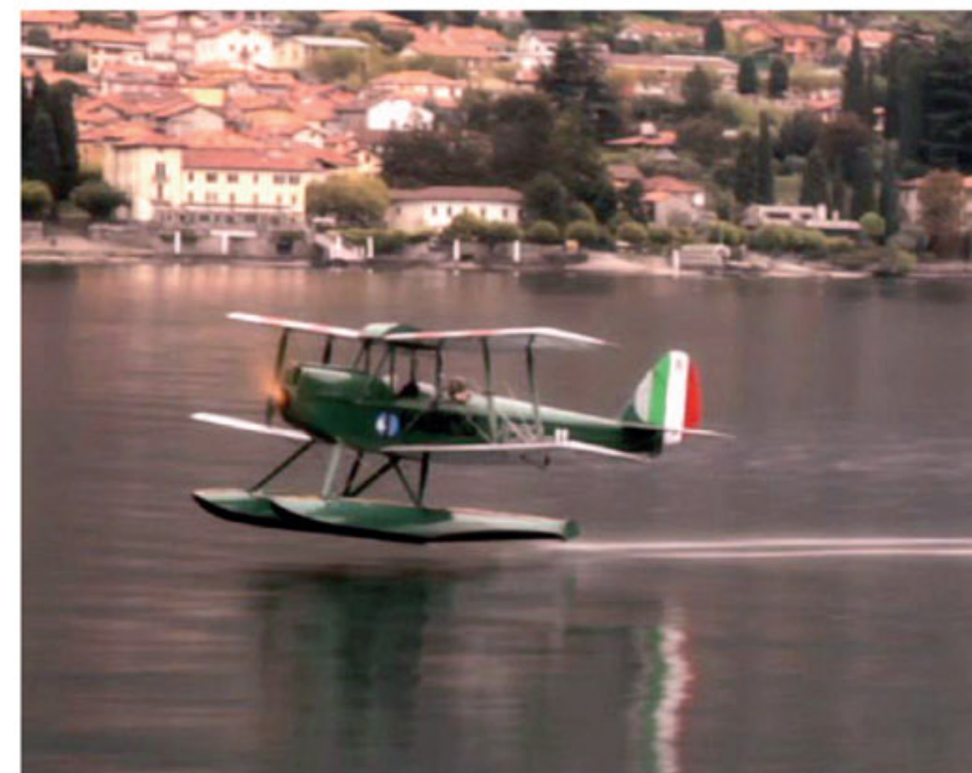
Sopra e sotto, il “Caproni” dell'Aero Club in azione durante il documentario